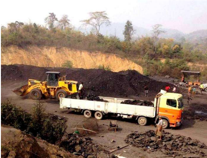
ကျောက်မီးသွေး ကားများအလုပ်လုပ် နေပုံ

ဒေသခံများ က ယခု ၂၀၁၇ တွင် လေထုညစ်ညမ်းမှု ပိုဆိုးလာသည်ဟုပြောသည်။ နမ့်မရှိ ကျောက်မီးသွေး တွင်းကို မန္တလေးအခြေစိုက် ငွေရည်ပုလဲကုမ္ပဏီ က ၂၀၀၄ မှ စတင်တူး ဖော်ခဲ့သည်။ တူးဖော်သည့် လုပ်ငန်းခွင်သုံးနေရာမှပိန်းဆိုင်းရှိ ကျောက်မီးသွေးတွင်း ကို ရပ်ဆိုင်းထားသော်လည်း နားကွန်နှင့် ပန်ငါးရှိ ကျောက်မီးသွေးတွင်း ကိုဆက်လက်လုပ် ဆောင်နေပြီး နေ့စဉ်နေ့တိုင်း နောင်ချိုနှင့်မန္တလေး ရှိငွေရည်ပုလဲ ဘိလပ်မြေစက်ရုံ နှင့် သကြားစက်ရုံသို့ ပို့ဆောင်နေ သည်ဟုသိရသည်။