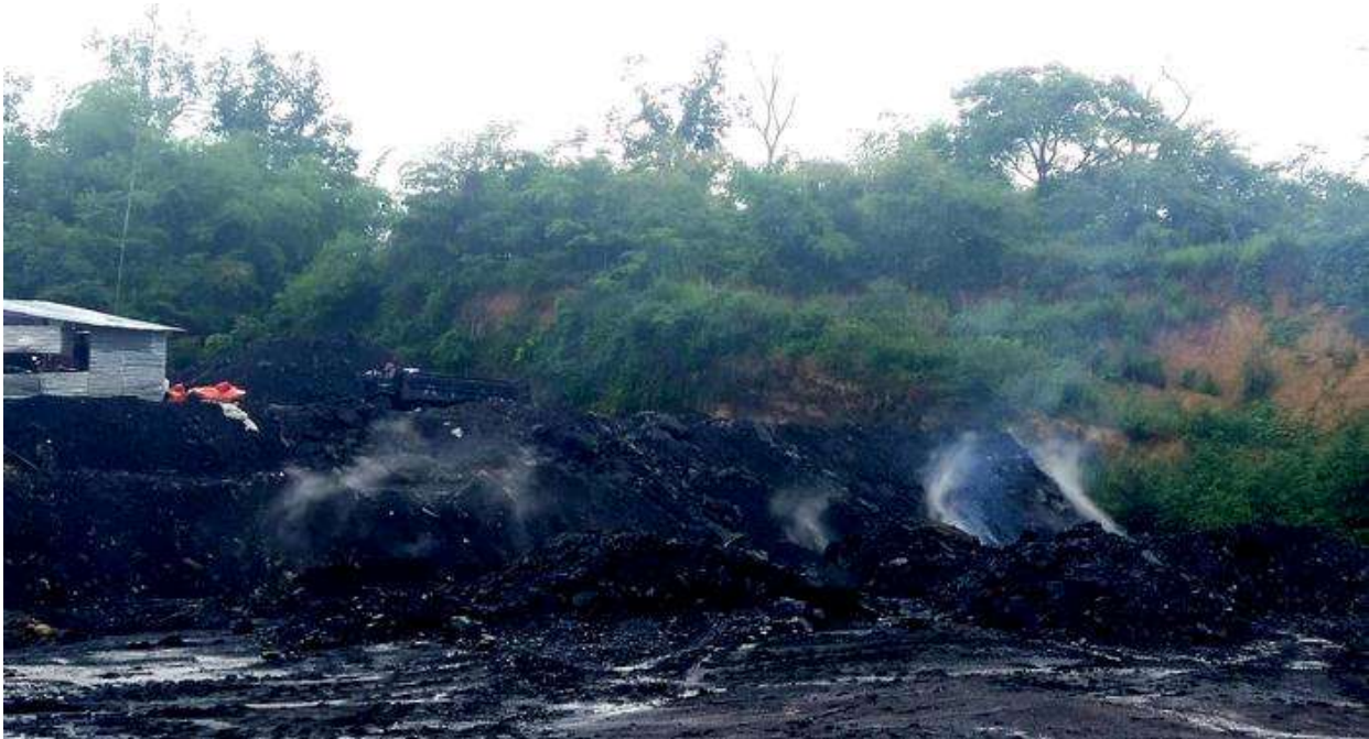
နားကွန်ကျောက်မီးသွေးတွင်း မှထုတ်လွှင့်နေသောအနံ့အသက်ဆိုး

နေမကောင်းဖြစ်လာသည့် အချိန်မှစ၍ သူသည် တစ်လ မှာ ၃-၄ ရက်လောက် သီပေါဆေးရုံတွင် ဆေးစစ်ကု သမှုခံယူရကာ ကြာတော့စီးပွားရေးထိခိုက်လာရသည်။ ဒီနှစ်အစောပိုင်း တွင် သူ၏ ဇနီးနေ မကောင်းဖြစ်ပြီး ချောင်းအလွန်ဆိုးကာ လွန်ခဲ့သည့် နှစ်လတွင် သေဆုံးသွားသည်။ သူ၏ ဇနီးလဲ တီဘီ ရောဂါ ကြောင့်ဟုသံသယ ရှိသော်လည်း ငွေကြေးအလုံအလောက်မရှိသောကြောင့် ဆေးရုံ သို့သွားရောက် မစစ်ဆေး နိုင်ခဲ့ ။